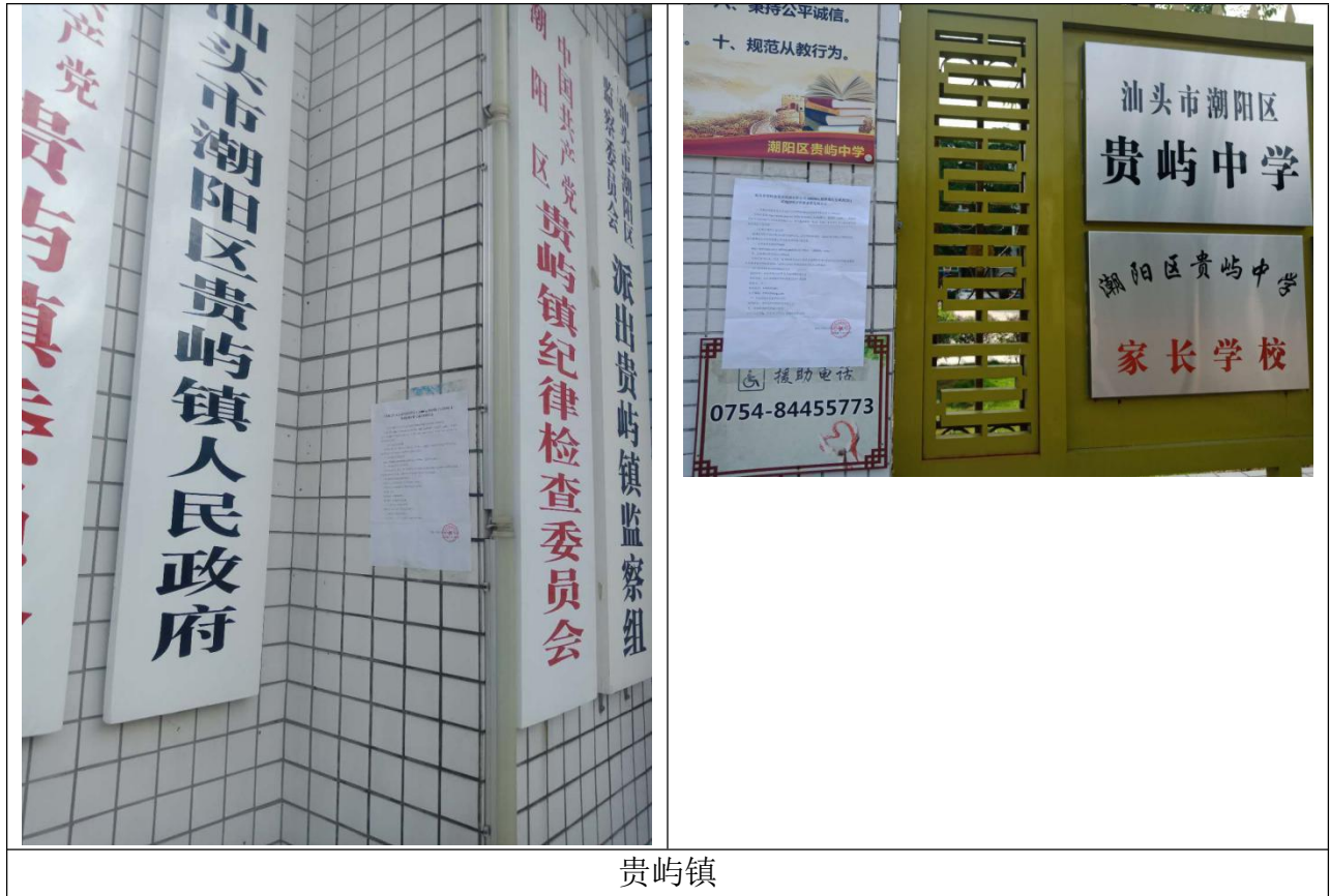
贵屿镇 图 3-2 征求意见稿公告公示