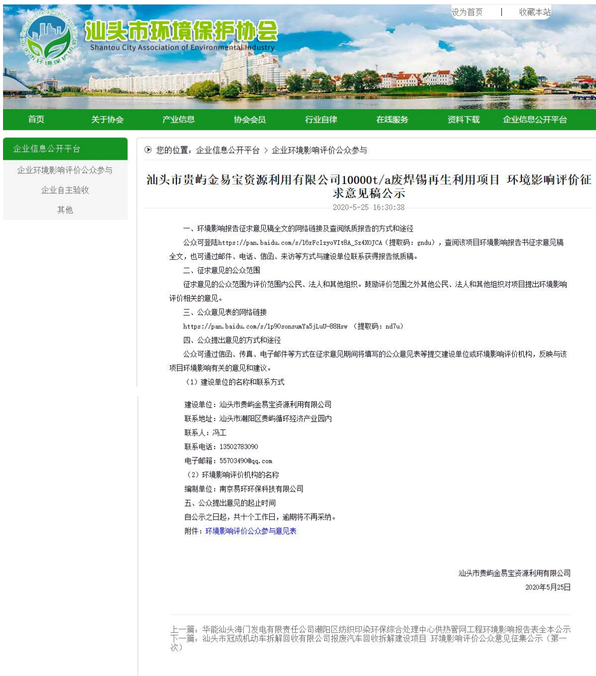
图 3-1 征求意见稿网络公示情况