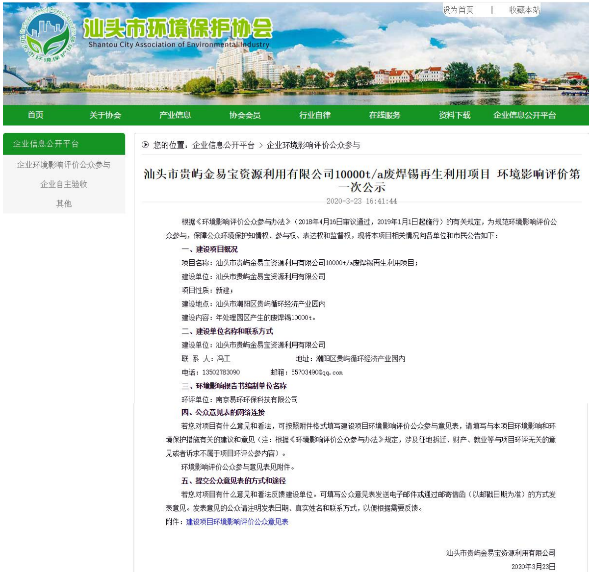
图 2-1 环境影响评价第一次公示网络截图